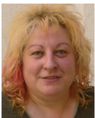
POR MARÍA MARTRAT

Diversos estudios científicos, realizados en el Reino Unido, Estados Unidos y la India, demuestran que el panchakarma, entre otros efectos, aumenta la capacidad de desintoxicación hepática, previene los factores de riesgo cardiovascular y, en sólo tres meses, es capaz de aumentar en un 80% un péptido intestinal que actúa como vasodilatador coronario. También reduce el colesterol total y aumenta el colesterol HDL en un 75%. A esta reducción de las dolencias corporales hay que añadir el aumento de la estabilidad emocional, la vita-