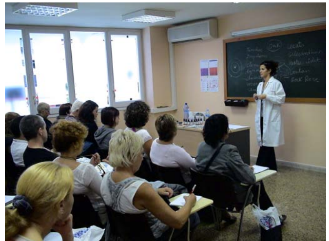
Imma Hospital en el taller de Flores de Bach / Coliseum